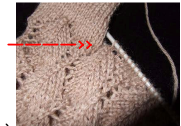
Fersenwand ist symmetrisch placiert und gestrickt

Es ist sehr wichtig das die Ferse symmetrisch mit dem Muster placiert werden. Sie muss über 3 „Dreiecken“ gehen (siehe Foto).